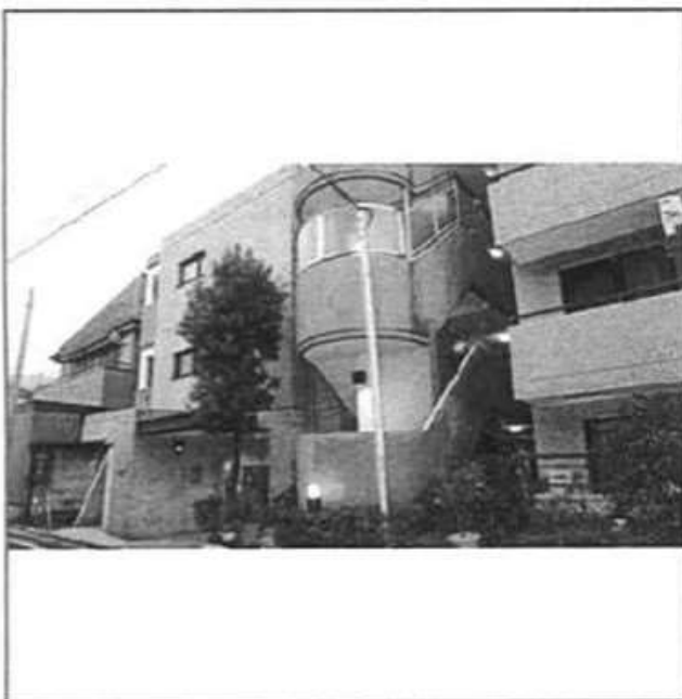
タイル張りの外観